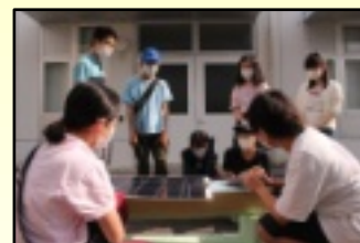
ソーラーボート作成