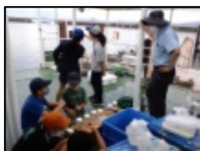
はっけん号での船上講座