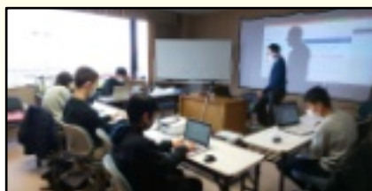
2年目から講義は研究室で行います