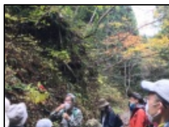
トチノキ観察《山》 9月19日・11月7日