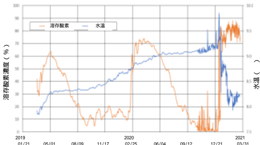
琵琶湖北湖湖底水温と溶存酸素濃度

特筆すべき変化は、2020年6月以降、琵琶湖の固有種であるピワオオウズムシ（図2）が全く採取できなくなったことです。ピワオオウズムシが好む水温は6～8といわれており、昔は水深30～40mの深さに生息していたようです。現在は湖全体の水温が上昇したので、80m以深へ移動しているのですが、酸素不足などもあり生息条件が厳しくなっています。ちなみに今年3月6日の調査では、小さなピワオオウズムシを2個体採取できました。ただ、図1に見られるように湖底の水温が8から再び上昇に転じており、今後さらなる冷却が起こらなければ、ますます絶滅に近づく可能性があります。びわ湖トラストでは、子供たちと一緒に、今後も注意深く湖底環境の監視とピワオオウズムシの観察を続けていきたいと考えています。