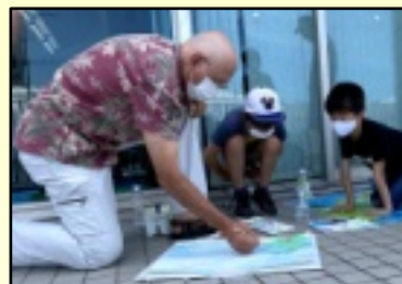
画家 プライアンに学ぶ写生 8月23日