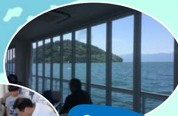
環境学習船 megumi 【メグミ】