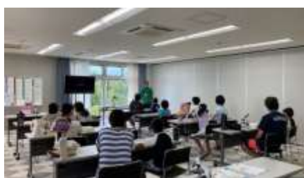
顕微鏡で映ったプランクトン