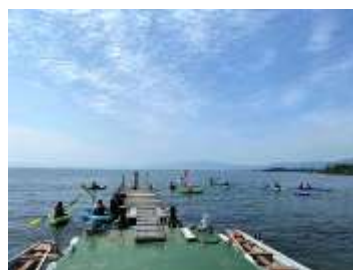
カヌー体験スタート