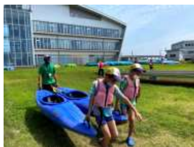
2人、もしくは3人で運ぶ