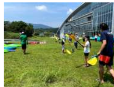
まずは陸で漕いでみる