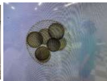
今回見えたプランクトンの1つ

いつもに比べると少人数の体験で、プログラム内容も2つに減ってしまったが、熱中症になることもなく全員が無事で、楽しく充実した時間を過ごしていただけたと思う。