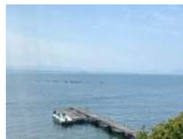
栈橋の向こう側で(カヌー体験)