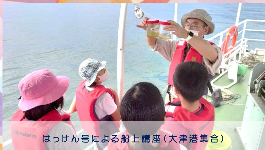
はっけん号による船上講座(大津港集合)