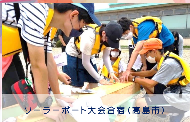
ソーラーボート大会合宿(高島市)