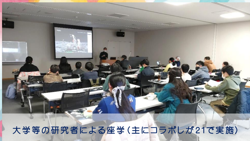
大学等の研究者による座学(主にコラボしが21で実施)